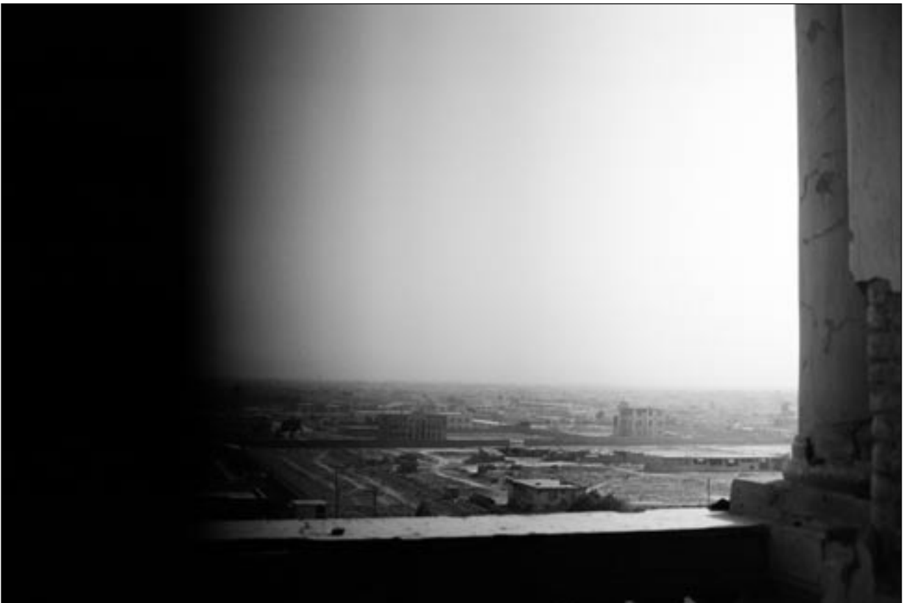
© Jeanno Gaussi, »Erased Memories 3«, Kabul 2008