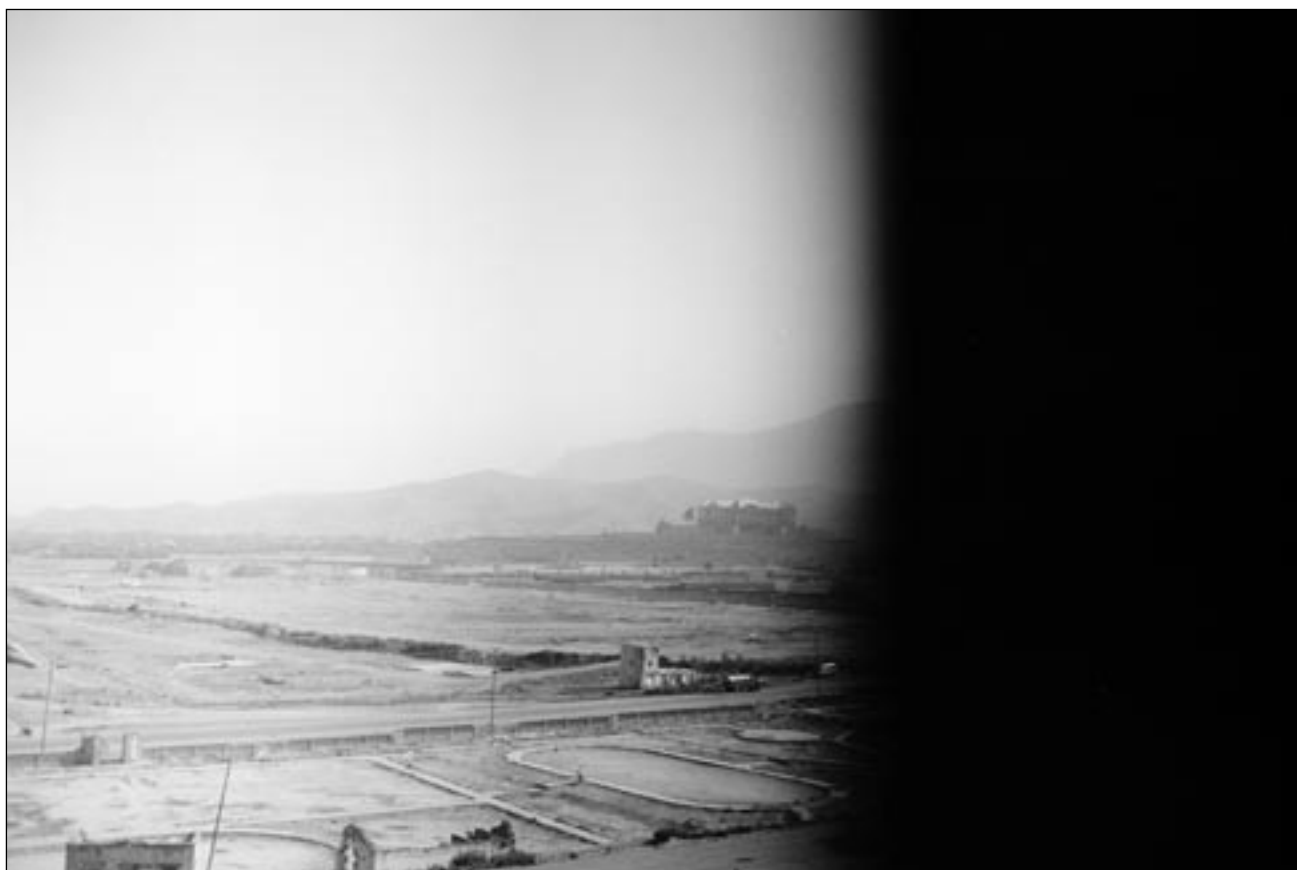
© Jeanno Gausi, »Erased Memories 2«, Kabul 2008