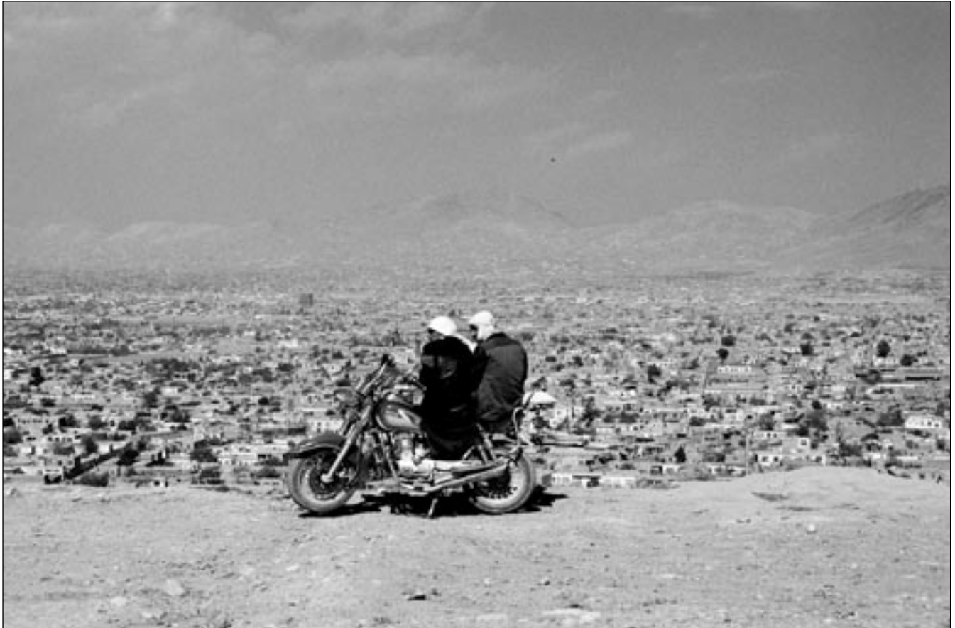
© Jeanno Gaussi, »Fragment 1«, Kabul 2009