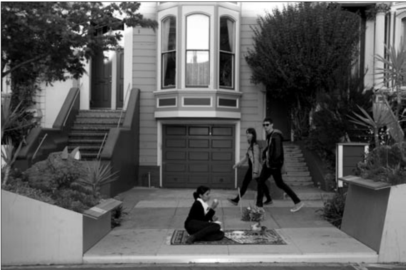
© Jeanno Gaussi, »Le Déjeuner Sur Le Tapis«, San Francisco, 2011