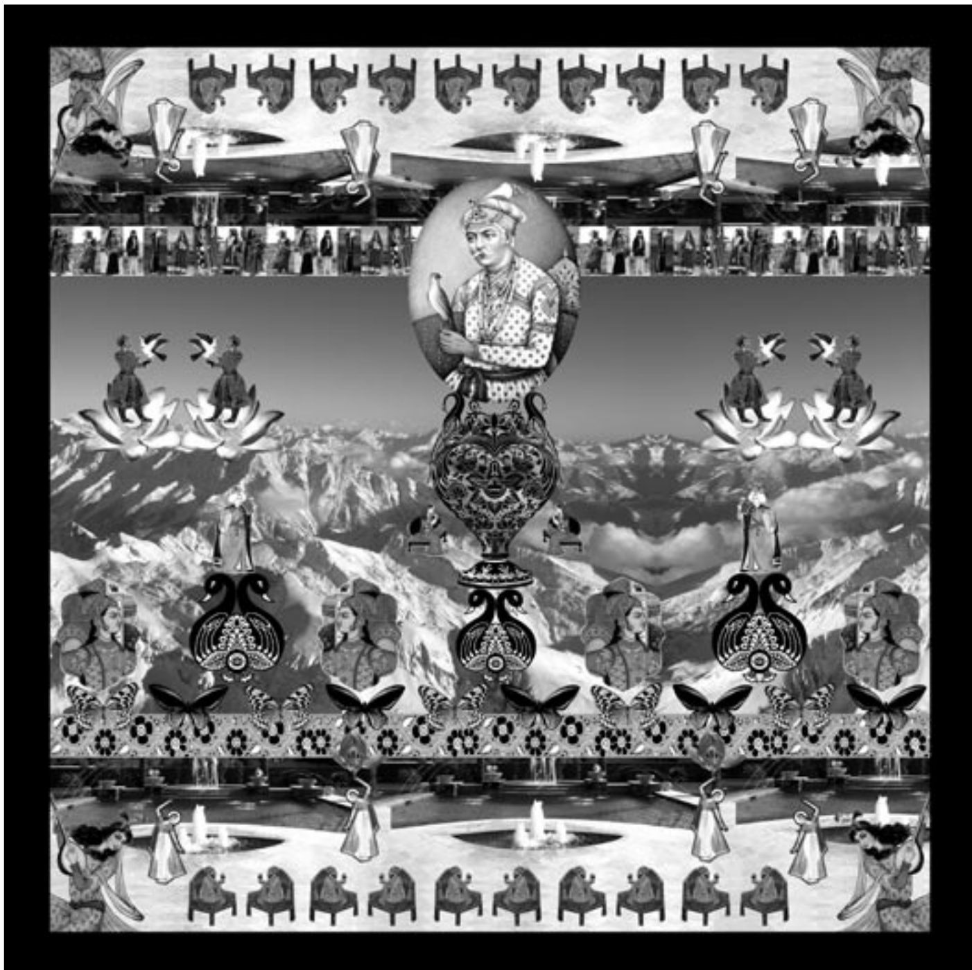
© Jeanno Gaussi, »Moghul Dream«, Karachi 2008