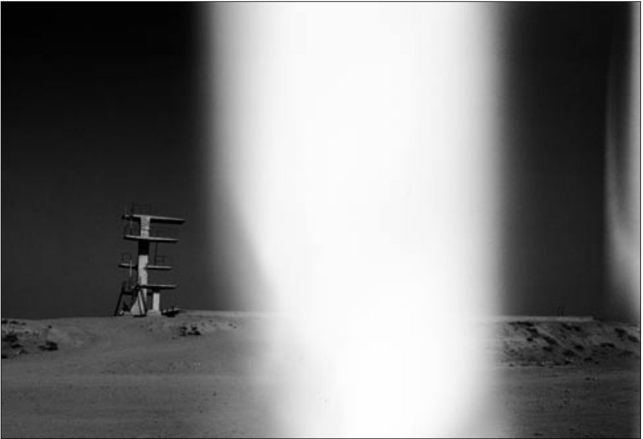
© Jeanno Gaussi, »Erased Memories 1«, Kabul 2008