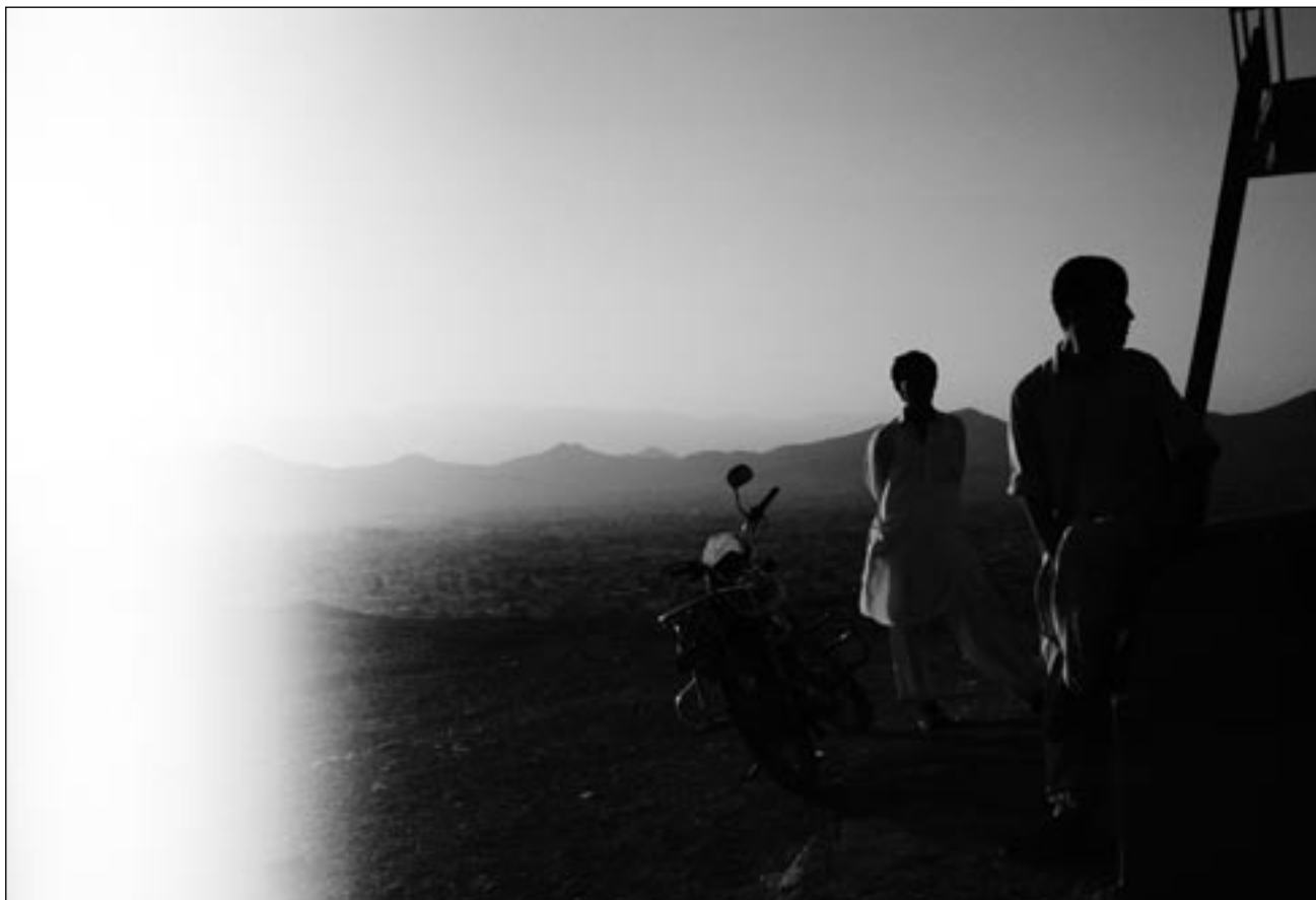
© Jeanno Gausi, »Erased Memories 5«, Kabul 2008