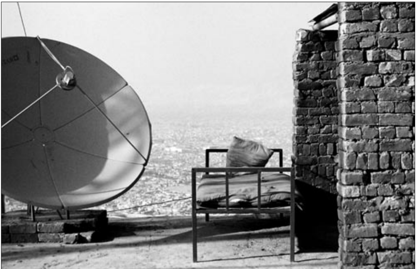
© Jeanno Gaussi, »Fragment 2«, Kabul 2009