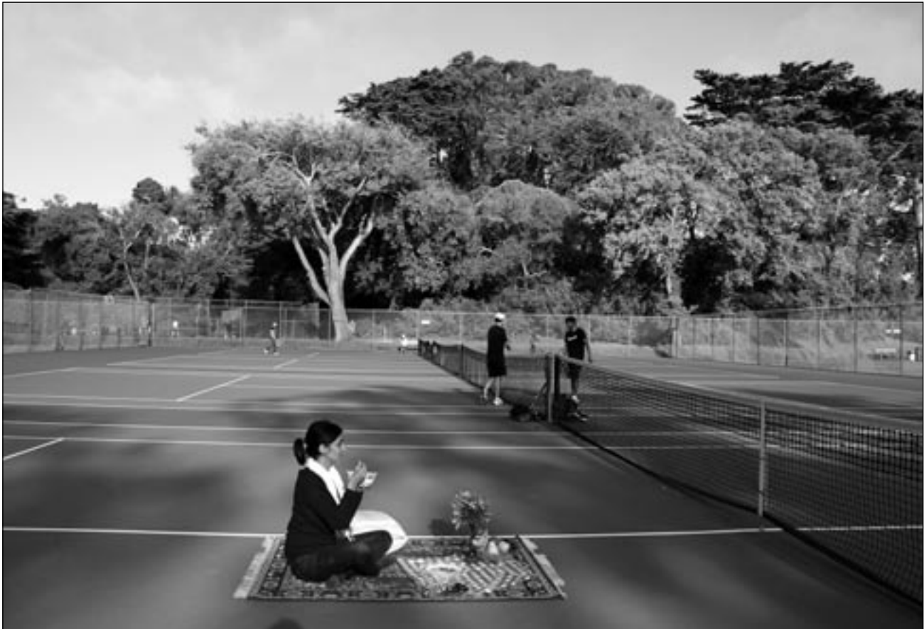
© Jeanno Gaussi, »Le Déjeuner Sur Le Tapis«, San Francisco, 2011