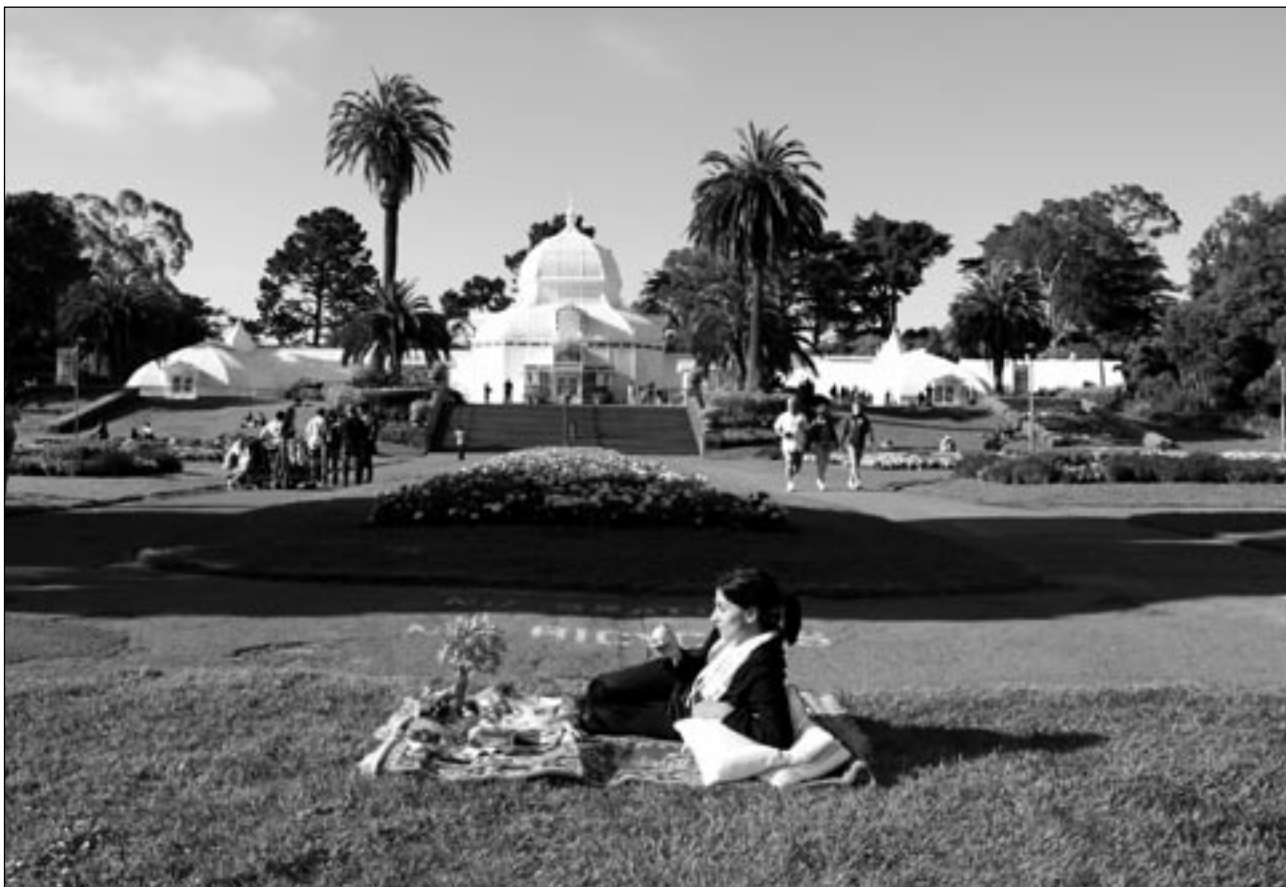
© Jeanno Gaussi, »Le Déjeuner Sur Le Tapis«, San Francisco, 2011