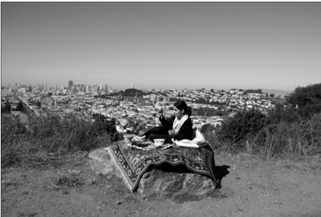
© Jeanno Gaussi, »Le Déjeuner Sur Le Tapis«, San Francisco, 2011