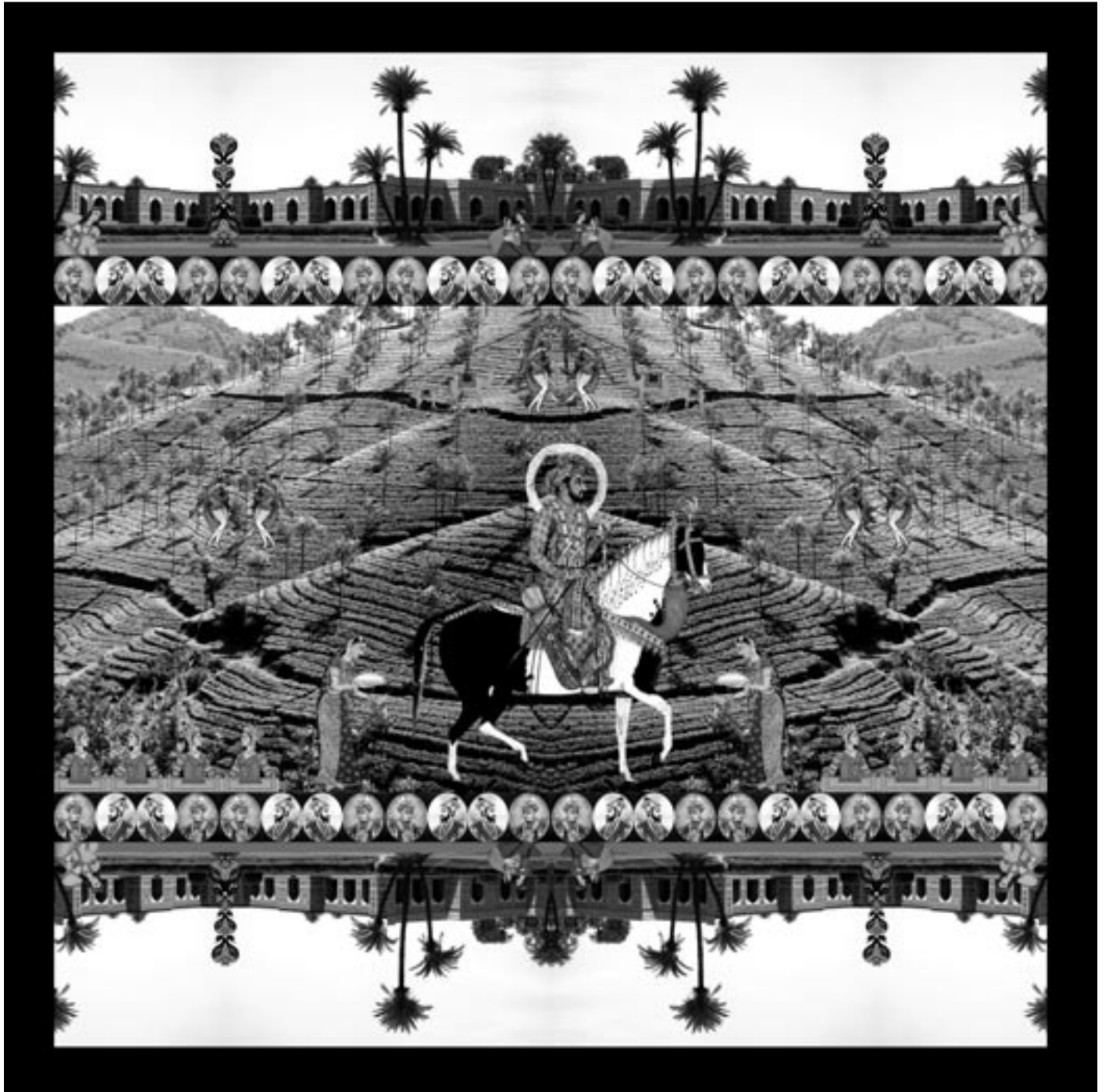
© Jeanno Gaussi, »Moghul Dream«, Karachi 2008